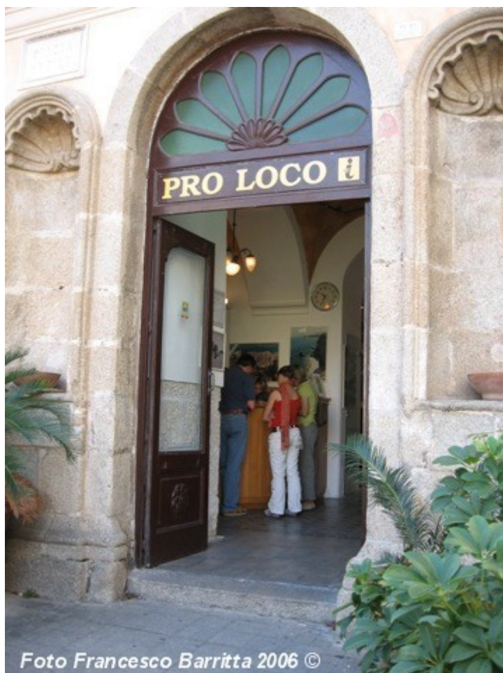
L'ingresso della Pro Loco con il simbolo IAT