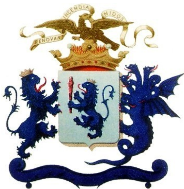
L'Arme dell'Antico Sedile, scelto come simbolo della Pro Loco